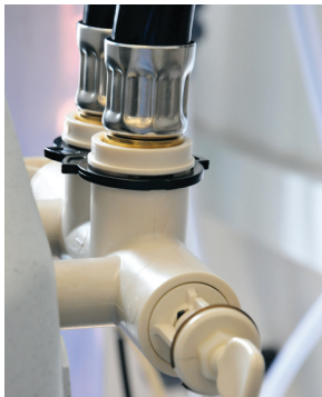
Końcówki klips: do by-passu Clip ends: into by-pass