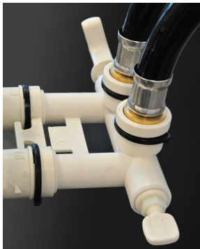
Końcówki klips: do by-passu Clip ends: into by-pass