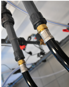
Końcówki gwintowane: do instalacji Thread ends: into piping