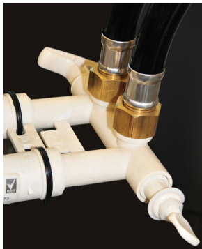
Końcówki 1": do by-passu 1" ends: into by-pass